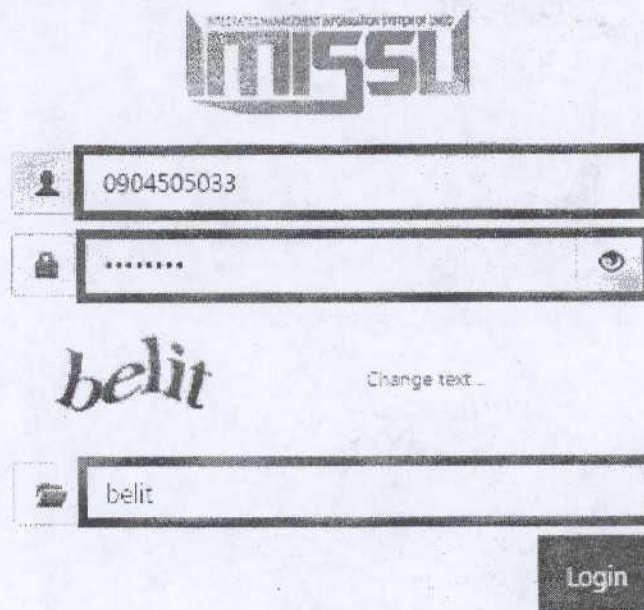
Gambar 1.2 Tampilan Login imissu