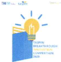
TBIC 1 .jpg 1206K