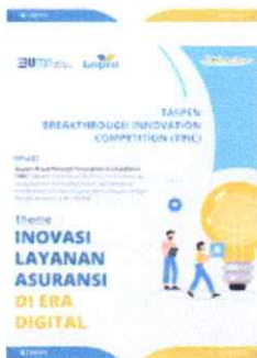
TBIC 2 .jpg 1723K